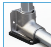
BRIDE DE PIED (CAOUTCHOUC OPTIONNEL)

Les installations Standard et Empilable peuvent également se combiner afin d'offrir la meilleure solution pour vos besoins.