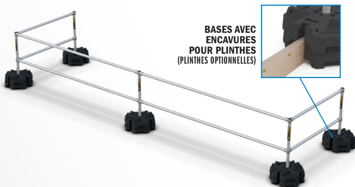
BASES AVEC ENCAVURES POUR PLINTHES (PLINTHES OPTIONNELLES)